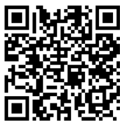
QR kód pro iOS

b) přihlásit se k již existujícímu účtu (Sign in).