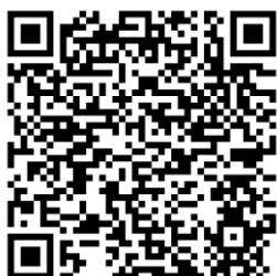
QR kód pro Android

a) vytvořit si účet (zaregistrovat se, Sign up) pomocí emailové adresy, která bude následně ověřena. Možnost stažení přes QR kód zde: